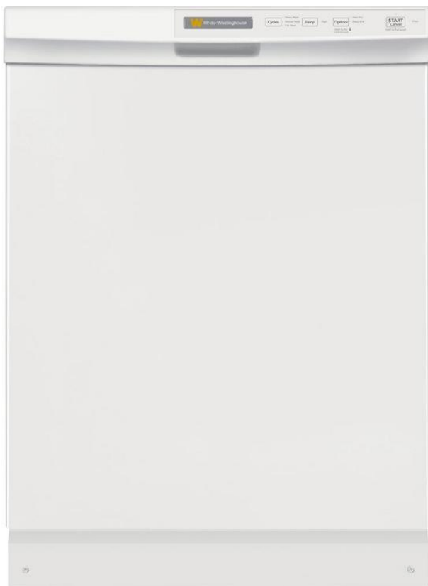
FFCD2413 定価 ¥270,000(税別)

パワフルかつ繊細な洗浄力と、スピーディーな仕上がり。理想的な静けさが、キッチンにゆとりの時間を演出します。